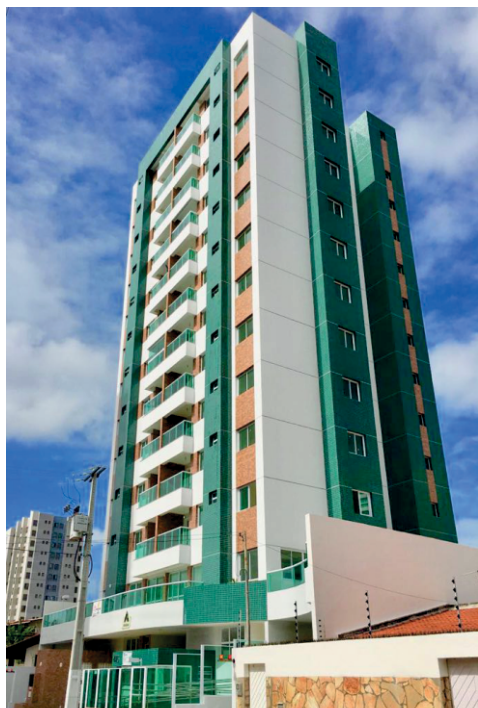
RESIDENCIAL ALTO BELO ARACAJU/SE

Nas conduções das responsabilidades profissionais e nas ações pessoais, os Integrantes devem zelar para que não haja conflito ou percepção de conflito de interesses.