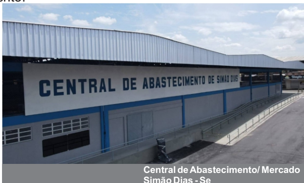
Central de Abastecimento/ Mercado Simão Dias - Se

Os contratos com fornecedores devem ser objetivos, sem margens para ambiguidades ou omissões, e devem conter cláusulas específicas sobre o compromisso com o atendimento das leis locais, inclusive com as leis anticorrupção.