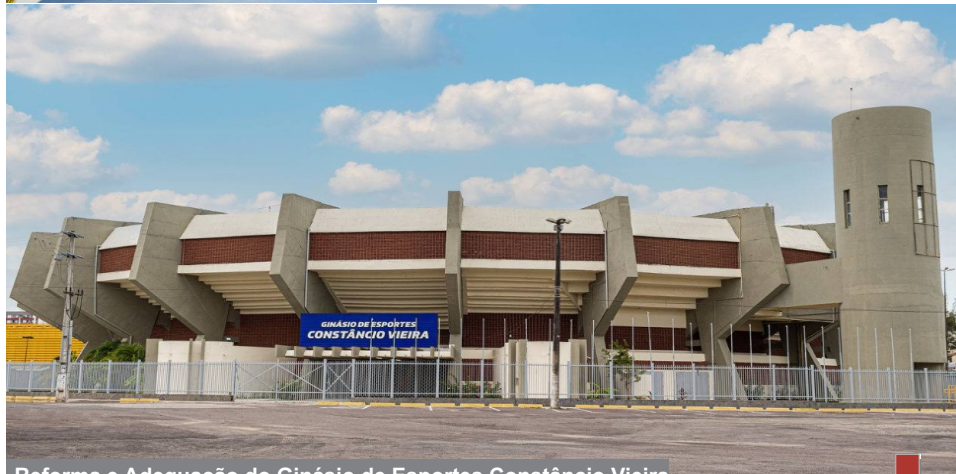
Reforma e Adequação do Ginásio de Esportes Constância Vieira Aracaju

Integrantes devem preservar e garantir a confidencialidade das informações da TECCOL ENGENHARIA LTDA que: