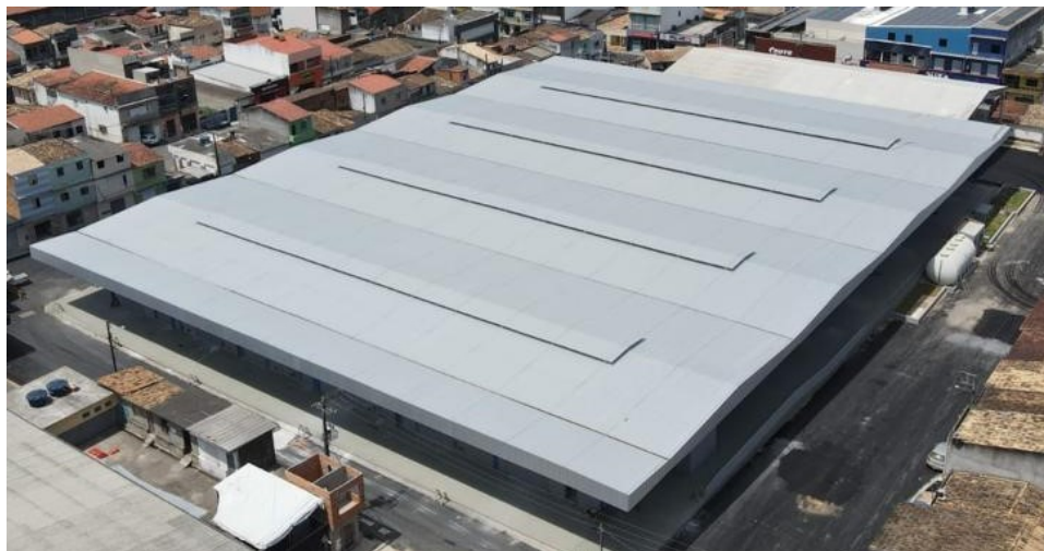
Central de Abastecimento SIMÃO DIAS/SE