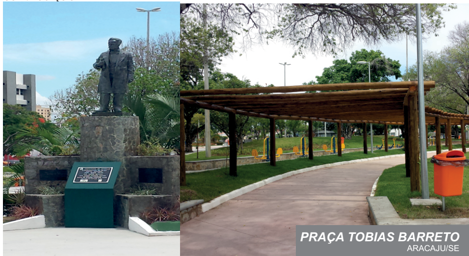
PRAÇA TOBIAS BARRETO ARACAJU/SE

As contribuições políticas em países onde a legislação permite, só podem ser feitas com a aprovação prévia de um programa específico, proposto pelo Líder empresarial, e devem ser amplamente divulgadas de forma acessível a todos os públicos. Nesses casos, o Líder empresarial deve diligenciar para que as seguintes condições estejam cumulativamente presentes previamente à contribuição.