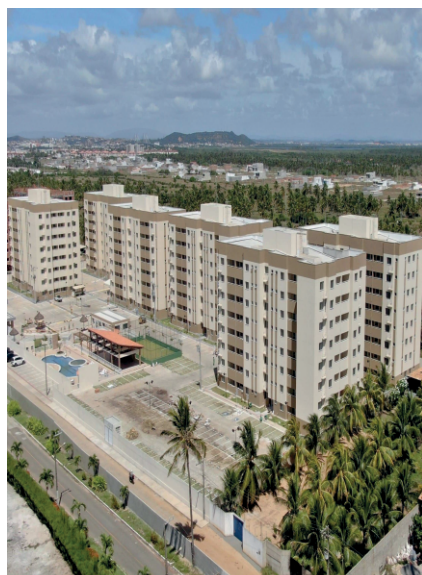
RESIDENCIAL HORTO DA BARRA BARRA DOS COQUEIROS/SE

O processo de diligência deve ajudar no estabelecimento do valor justo da empresa a ser adquirida.