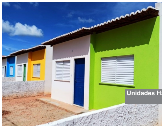
Unidades Habitacionais Mariota Mesquita - 5ª etapa Estância- Se

As decisões devem ser tomadas de forma refletida e fundamentada, adotando-se os instrumentos que assegurem sua transparência;