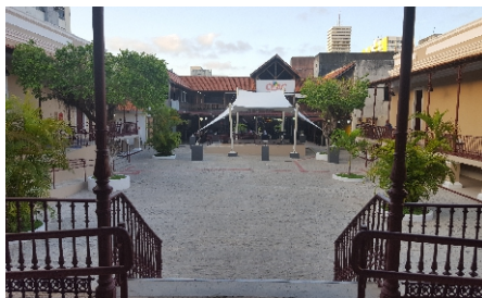
CENTRO DE TURISMO ARACAJU/SE

Em algumas circunstâncias, pode ser desejável e/ou necessário que a TECCOL ENGENHARIA LTDA apresente uma proposta conjunta com um concorrente para determinado projeto. Atividades conjuntas, apesar de não serem necessariamente ilegais, podem dar ensejo a questões concorrenciais complexas e, por isso, precisam estar bem documentadas para que fiquem claras a sua legitimidade e a sua racionalidade econômica. Nesses casos, é recomendada a consulta ao compliance officer da unidade de negócio no local de atuação. Os Líderes devem procurar ganhar negócios e terem participação de mercado por mérito do melhor preço, qualidade, prazo e atendimento. Nenhum Integrante deve realizar negócios ou propor ações que descumpram as disposições deste documento.