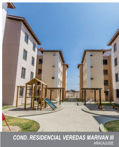
COND. RESIDENCIAL VEREDAS MARIVAN III ARACAJU/SE

Os demais Investidores são satisfeitos com o retorno adequado de seus investimentos e com a valorização segura do seu patrimônio investido na TECCOL ENGENHARIA LTDA. O relacionamento com todos os clientes e investidores deve ter como base a comunicação precisa, transparente, regular e oportuna de informações que lhes permitam acompanhar o desempenho e as tendências da TECCOL ENGENHARIA LTDA, especialmente aquelas que impactam os resultados tangíveis e intangíveis. Para tanto cada Integrante deve se assegurar que as informações decorrentes das suas atividades estão sendo produzidas e organizadas de forma que possam ser disponibilizadas aos Integrantes responsáveis pela comunicação.