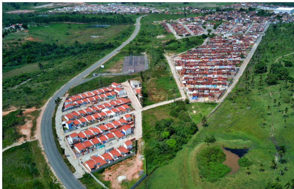
Conjunto Habitacional Mariota Mesquita Estância/SE

Diante do exposto, caso o Integrante tenha dúvidas sobre qual conduta adotar diante de uma possível ação questionável, própria ou de terceiros, deve levar o assunto ao conhecimento de seu Líder direto, de forma aberta e sincera, ou ao órgão colegiado denominado Comitê de Ética, até que a dúvida seja sanada, não sendo aceita, a omissão ou alegação de desconhecimento.